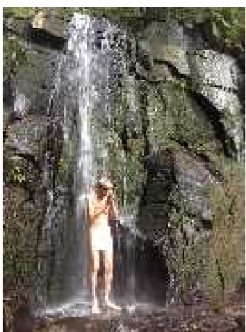
小ヶ倉観音の滝行