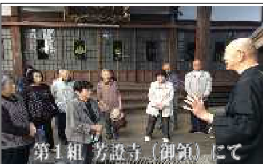
第1組 芳設寺(御領)にて

天草八十八ヶ所 住所 天草市本渡町広瀬140の4 霊場先達会 電話 0969(23)3276 事務所 FAX 0969(23)3839