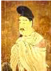
安倍 晴明 延喜21年1月11日 ～寛弘2年9月26 日、平安時代の 陰陽師