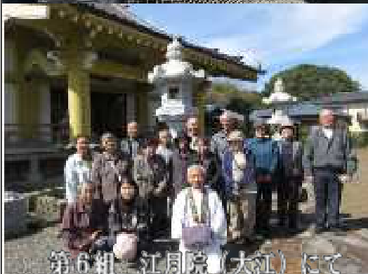
第6組 江月院(大江)にて