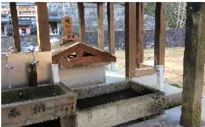
写真、右は教良木の「宝幸水」、左上が福連木の「官山の水」で、左下が佐伊津町の「延命地藏尊の水」