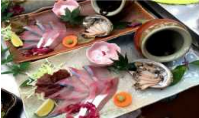
湯島自慢の新鮮な海の幸が楽しめる

台」、オリジナルの限定焼酎『湯島』など、いろんな方たちの努力でだんだん有名になっていきました。