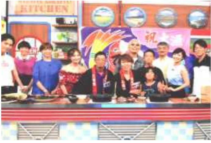
所ジョージさん「うまい！この吸い物、ペットボトルで売ってほしい！」と大絶賛