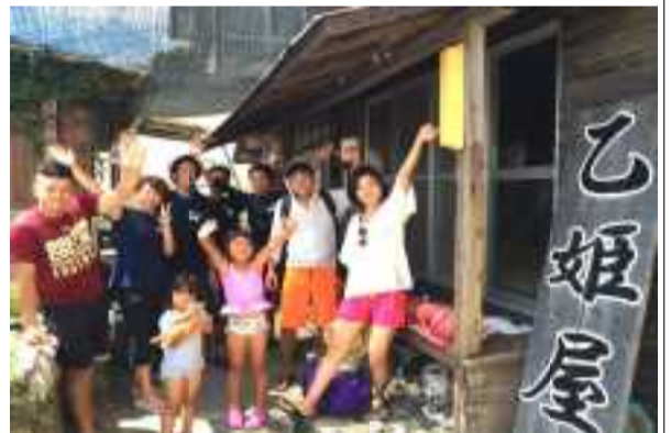
お陰さまでどんどんお客様が増えています！

とても悩みました。安くすると喜んでもらえると思っただけですが、その分食材も減るし、団体には人手もいるから人を雇わないといけないので、採算がとれないのです。必死にやっていたのにクレームの嵐に悩みました。