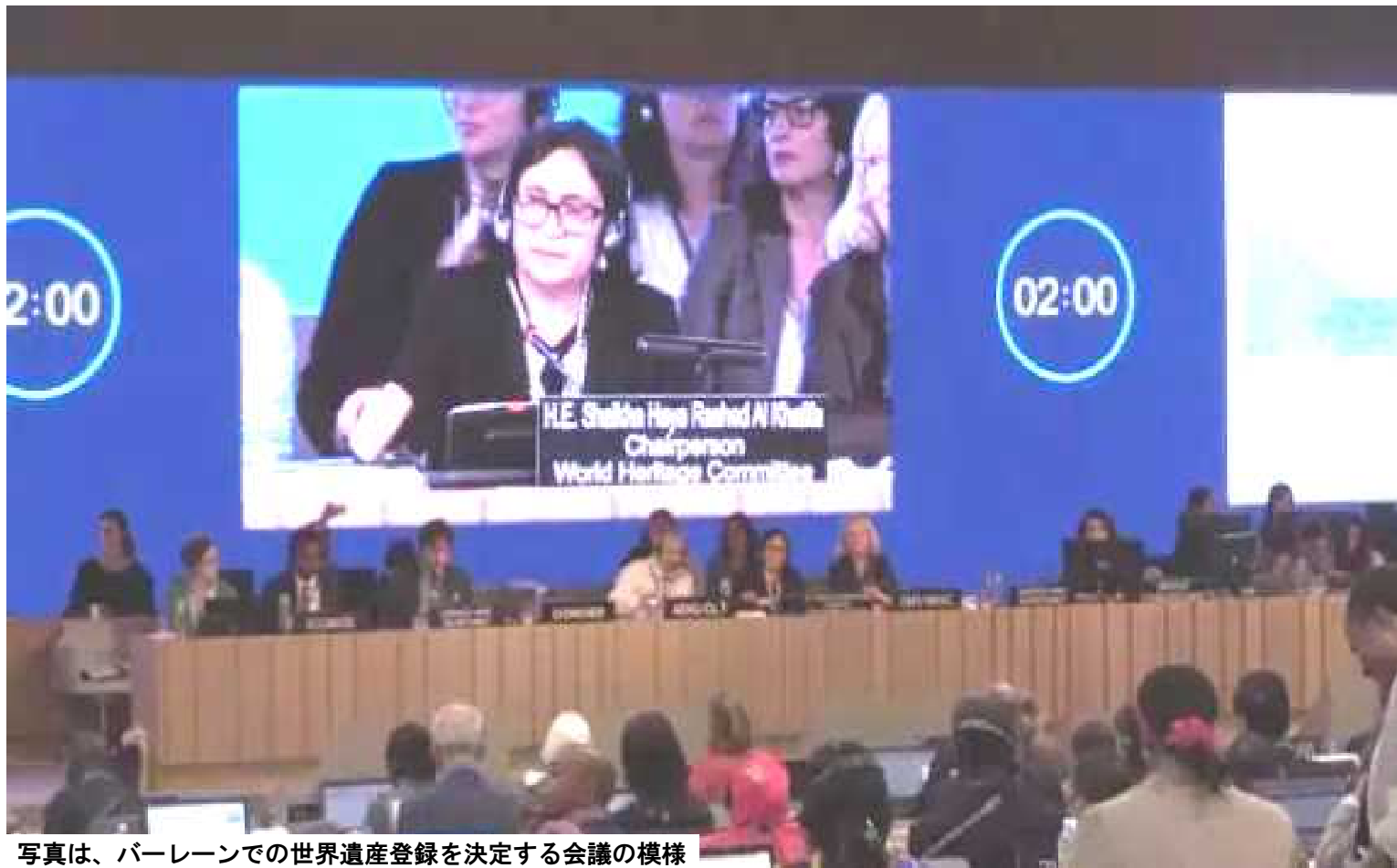
写真は、バーレーンでの世界遺産登録を決定する会議の様

6月30日バーレーンで開催された今年の世界遺産登録を審査する会議で、「長崎と天草地方のキリシタン関連遺産」が決定した瞬間は、あまりにも感動的だった