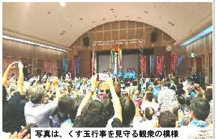
写真は、くす玉行事を見守る観衆の模様

今日の登録発表でこれからますます人が増えると思いますが、本当に大切な天草の歴史と文化を伝えていくように努力していきたいと思っております。