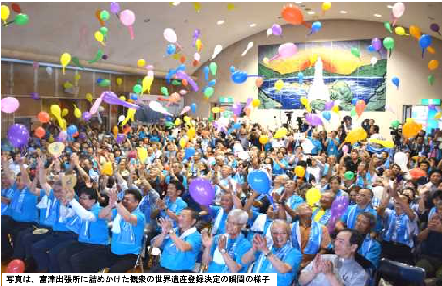
写真は、富津出張所に詰めかけた観衆の世界遺産登録決定の瞬間の様子

世界遺産登録の瞬間を観ようと富津コミュニティセンターには特設パブリックビューイングが設けられ、天草市や地元住民など、多くの人たちが詰めかけた。その模様は、天草ケーブルネットワークとみつばちラジオで、同時生中継が行われた。