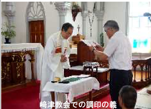
崎津教会での調印の義