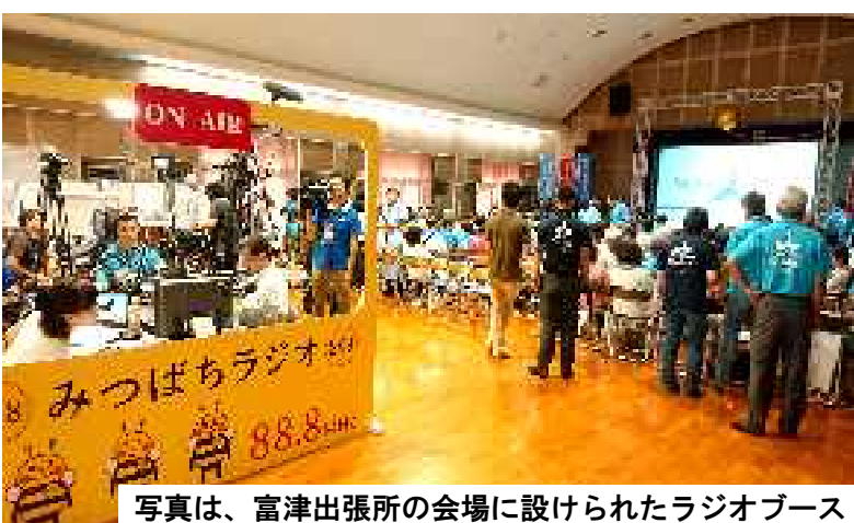
写真は、富津出張所の会場に設けられたラジオブース

やって下さいと言って下さったお陰で、思い切って進めることができ、今回の登録となったことに、お礼を申し上げます。今後、この地域の振興策にさらに力を入れて行きたいと思っております。