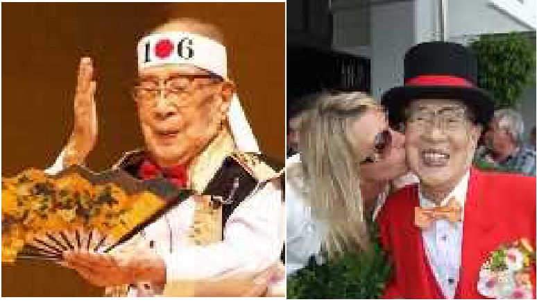
106才の黒田節(左)と 世界旅行(右)の昇地三郎先生

106才で40代の脳年齢 以前のさる新聞でご紹介したことがある106才の教育学者で、2012年11月28日に天草市民センターで「不老長寿虎の巻」のタイトルで講演をされた福岡教育大学名誉教授の昇地三郎先生は、95才から中国語を習い始め、100才からフランス語とロシア語を習い始め、106才で世界最高齢者の最長移動距離(世界一周旅行)のギネス記録を出されました。