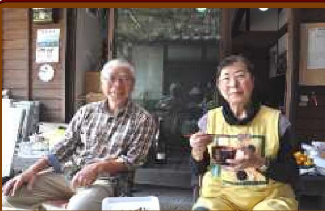
民泊「呼群堂」を営む桂木夫妻

その意味で、いかに地域住民が積極的に活動するかによって、それぞれの地域の将来が変わってきます。