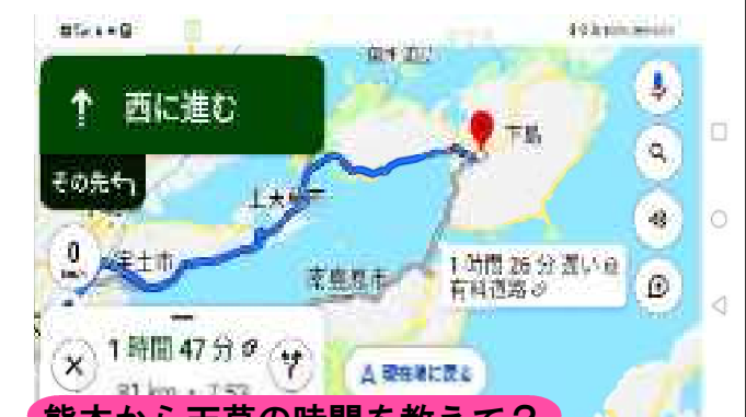
熊本から天草の時間を教えて？ 「熊本から天草までの時間を教えて」と言うだけで時間と距離を表示してくれる

認知症になるのは脳細胞を使わなくなるからで、スマホを使う人は常に脳トレをしているのと同じで、脳細胞が活性化し若々しさを保つことができます。スマホには、将棋、囲碁、カラオケ、トランプ、麻雀、クイズ、ゲームなど無料で使える楽しいアプリもたくさんあります。