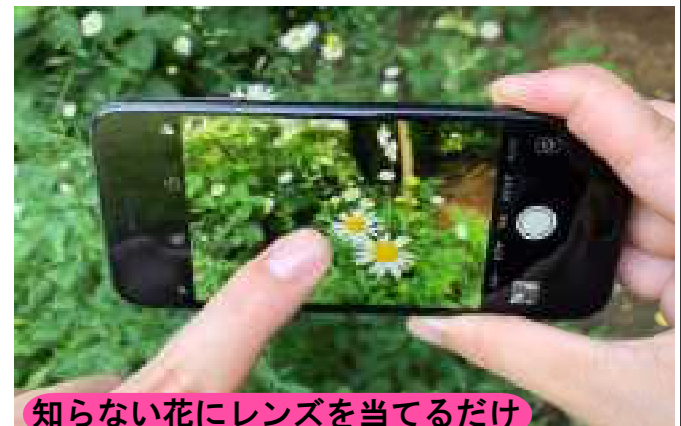
知らない花にレンズを当てるだけ 道端の知らない花にスマホのレンズを当てるだけで、花の名前をすぐに表示してくれる

人間の脳細胞は何かを新しく学習する時に著しく発達します。それは年齢に関係なく100歳を越えて語学を学習する人の脳を計ったら40代の脳年齢であった事例もあります。