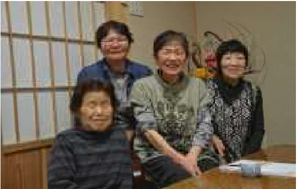
活発な活動を支える女性会員

すなわち、「まだ働き盛り」の「若い人」でも参加できる活動と組織改革を実現できれば、老人クラブは再生できるという算段がありました。