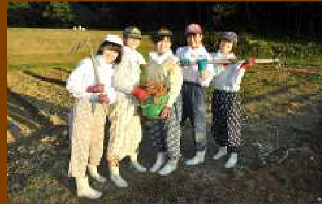
もんぺ姿ではじめての農業体験