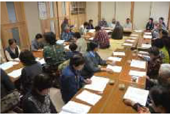
大所帯となった諏訪老人クラブ総会

高齢者といっても様々な高齢者がいる、という現状をふまえた活動が求められていると感じました。その次に、役員の高齢化と固定化という問題です。多くの老人クラブにみられるこの問題は、本来任期が二年で交代する決まりが