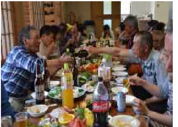
大切にしている地域の絆

現在、若手がなかなか参加しないと思われていますが、クラブは多いと思えますが、今一度諏訪老人クラブの組織改革に見習い、誰もが平等に役割を担い、しかも楽しく老人クラブに関われる仕組み作りを検討してみたいかがでしょうか？