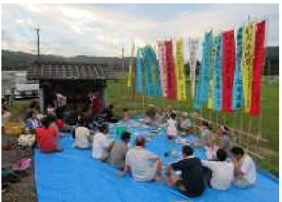
今も続く諏訪地区の地蔵祭り

また、誰でも平等に役員になる機会があることで、老人クラブの活動を地域全体で取り組むように変貌しました。