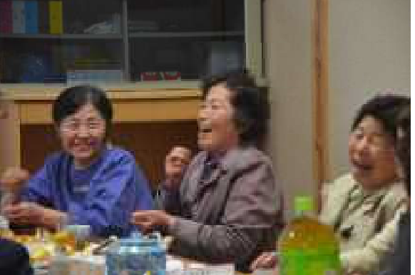
いつも笑いが絶えない定例会

その結果、35名（後期高齢者26名、前期高齢者9名）だった諏訪老人クラブは、総勢50名（後期高齢者23名、前期高齢者27名）へと組織飛躍をとげました。