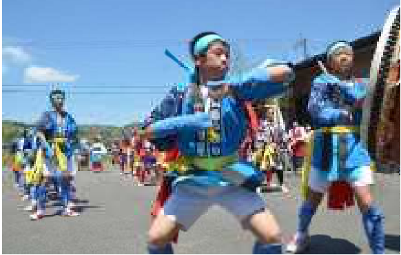
地域の伝統を受け継ぐ子ども達

役員の決め方は、年齢順を基本に三役体制をつくり、その任期は1期1年とする。27名の「若い人」を4つの班にわけ、役員は4年に1度の輪番制で各班に巡ってやるようにしました。