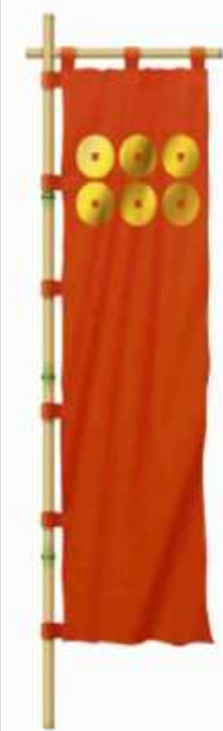
真田六文銭組の旗印

そもそもどうして真田軍は「六文銭」の旗印を掲げていたのでしょうか？ 六文銭は地藏信仰による仏教色の強い家紋で、仏教