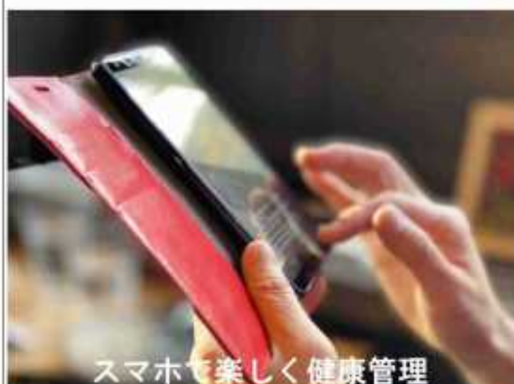
スマホで楽しく健康管理

だけど、歩くのは面倒で面 白くないと、思う人もあるか もしれません。 本当にその通りです。すで に歩く習慣が身につけている 人はいいのですが、そうでな い人は「いまさら歩くこと？」 とあまりに単純過ぎて興味が わなくなるかもしれません。 でも、工夫次第で歩くこと が楽しくなり、生きがいにも なります。 その秘訣が、楽しく歩きた めにスマホを十分に活用する ことです。