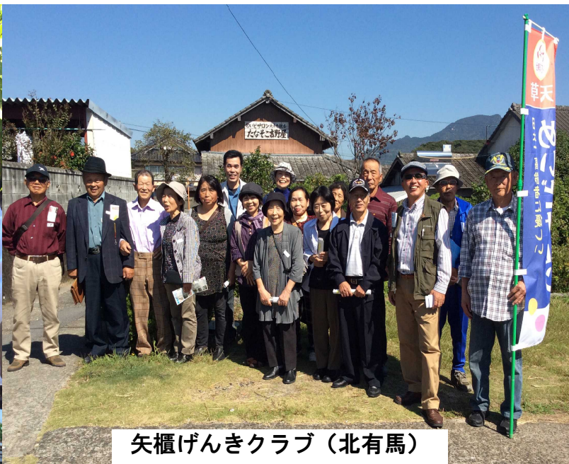
矢櫃げんきクラブ（北有馬）