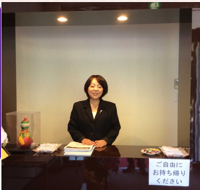
ファミリースペース・天草の受付

ファミリースペース・天草は 最期のお別れの時を大切にする 家族のための葬祭場を提供します