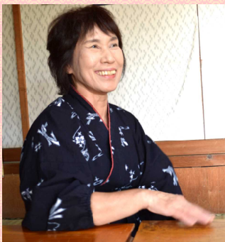
めいどサロン吉野屋 おしゃべりピーコさん

お布施や食事の接待費等は、 当初の費用には含まれておらず いざ葬儀になれば、慌しくて対