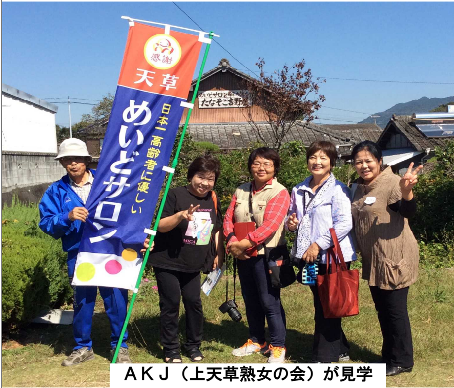
AKJ (上天草熟女の会) が見学

ところが、現代は日本人の平均寿命が延びて、その分生きる時間が長くなりました。でも多くの高齢者が、時間を持て余し、テレ