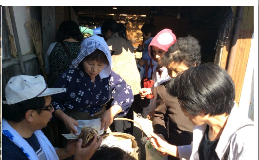
めいどの土産が大繁盛！