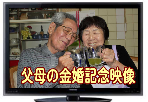
父母の金婚記念映像