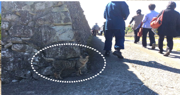
キジ猫も石垣で、お迎え！