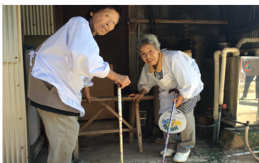
めいどの土産を作る熟女メイド