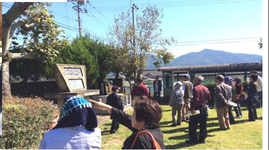
野口雨情が作った棚底小校歌！