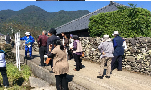
こぐりが石垣の中を200mも！