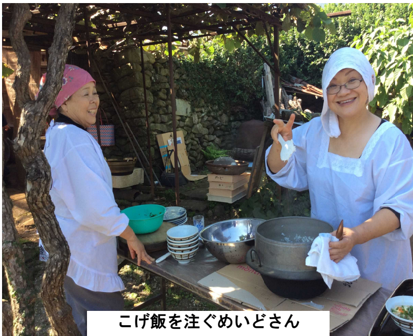
こげ飯を注ぐめいどさん