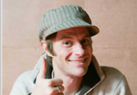
めいどサロン好きなセインカミュ

人間の細胞は使わなければ退化しますから、何もせずにいると頭はボケ、体力は落ちてしまいます。