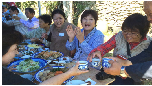
島原と上天草の初対面同士で乾杯

電話 080-5214-1561 メール amakusa39@ezweb.ne.jp