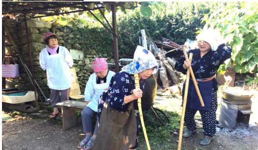
演劇もおもてなしの一つ