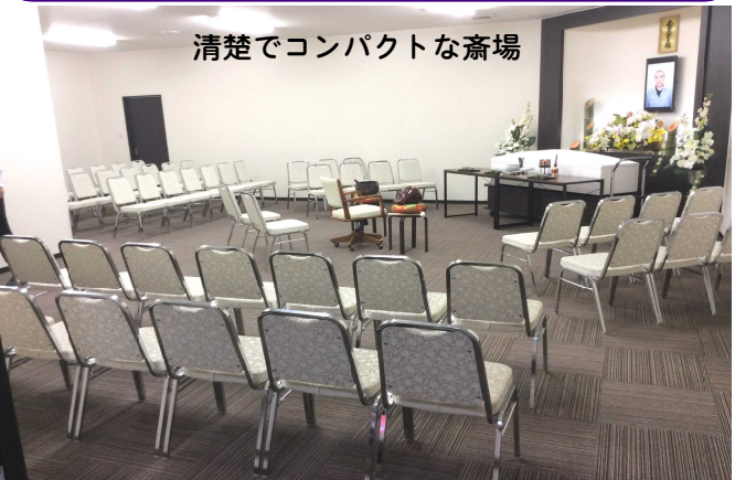
清楚でコンパクトな斎場

家族を中心に身近な人たちだけ小人数 (~80人)で心から最期のお別れを大切 にするご葬儀の場をご提供致します。