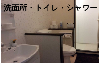
洗面所・トイレ・シャワー