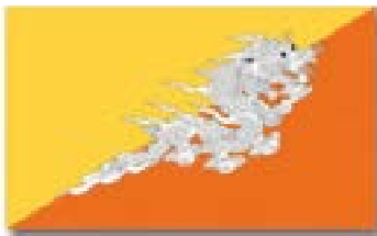
ブータン王国の国旗（龍がシンボル）

GDP(Gross National Product) 国民総生産(物の豊かさを追求)