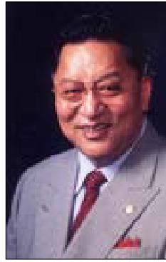
桐蔭横浜大学 大学院教授・国際政治学者・1953年チベット生まれ、1965年来日。チベット文化研究所名誉所長、岐阜女子大学名誉教授