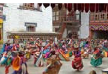
ブータンの民族舞踊 (伝統文化が守られている)

民総幸福度」(Gross National Happiness: GNH)です。また日本人に大きな関心を抱かせたのは、二〇一一年十一月の現国王と王妃の日本への公式訪問であったと思います。まずブータンという国を少しご説明します。ブータンの国土は三八、三九四平方キロメートルで、日本の十分の一ぐらいです。人口はわずかに六七万強、日本の江戸川区の人口に相当します。宗教は仏教徒が圧倒的に多いのですがヒンズー教、ボン教も存在しています。そもそも十七世紀にチベット仏教のカリスマ高僧、ガワン・ナムギェル師が信徒を組織化し、政治的、軍事的にこの地域の部族たちを統一し、正教一致国家を建設しました。その後東部の豪族ウゲン・ワンチュクが周辺の部族たちを配下に入れつつ、やがて一九〇七年に正式に俗人として初代の藩王に就任し、今日のワンチュク王朝の基礎を築き、現代に継承されています。ブータンの成り立ちを理解していただくためにも、今回はブータンの第四世国王ジグメ・センゲ・ワンチュク陛下と現国王第五世ジグメ・ケサル・ナムギェル・ワンチュク陛下に関して触れたいと思います。