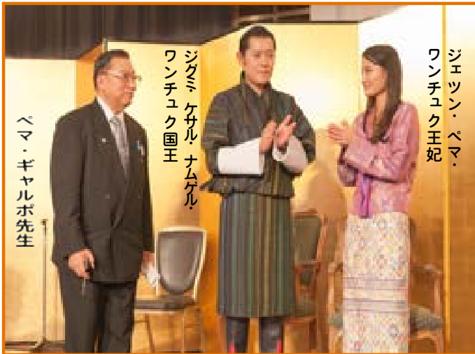
ジェツン・ペマ・ワンチュク王妃