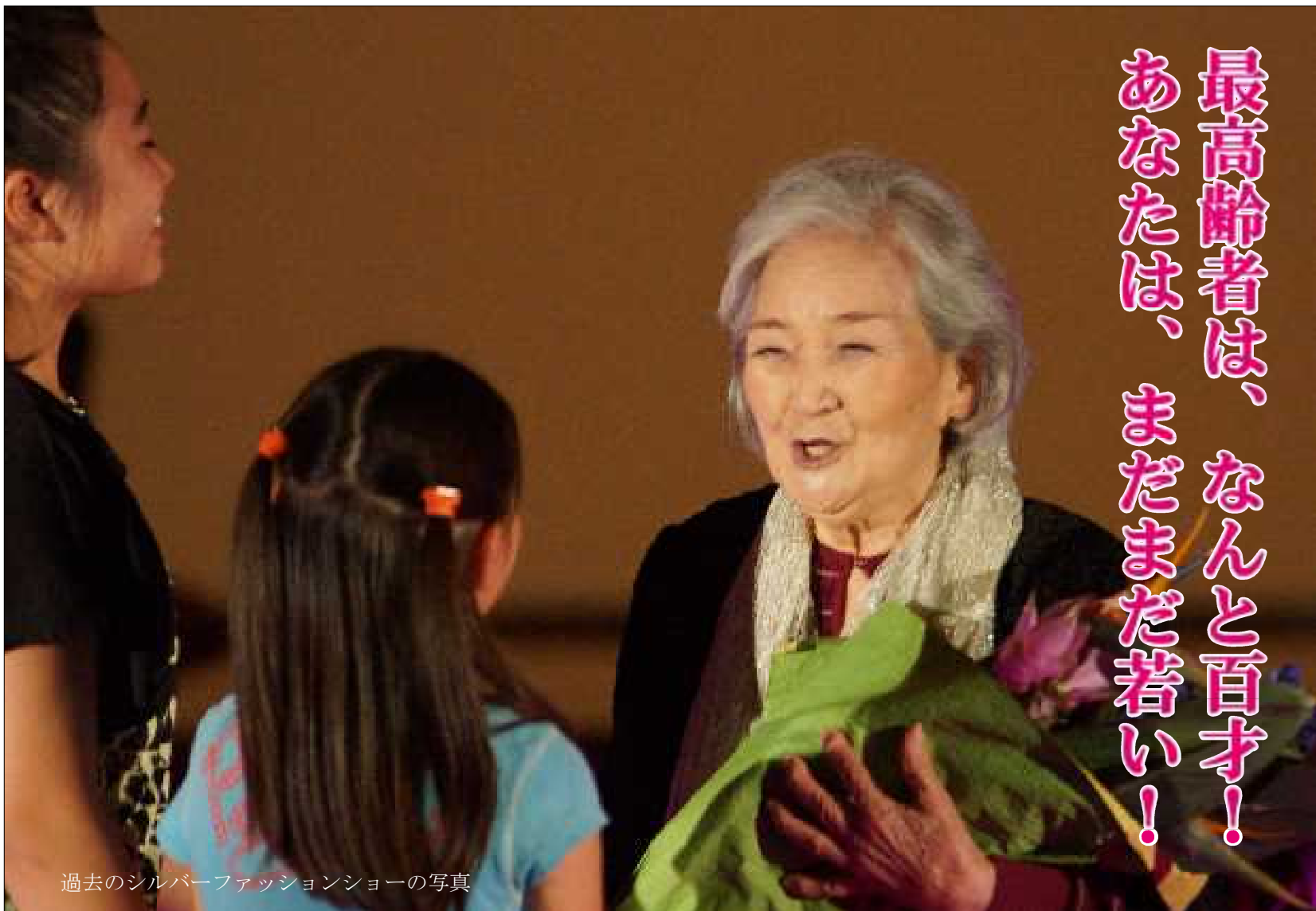
過去のシルバーファッションショーの写真

【名称】のさる新聞（無料） 【編集】花咲 実 【発行者】あまくさ生きがいネット 【所在地】天草市本渡町広瀬140-4 【電話】0969(23)3276 【制作】ノサリート 《平成26年4月18日 初版発行》