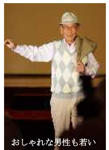
おしゃれな男性も若い

化粧品会社の資生堂では、ライフクオリティ事業で、介護施設の高齢者を対象にお化粧によるボランティア活動をしています。