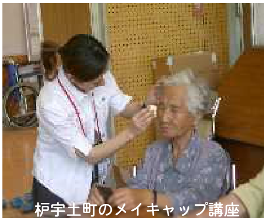
栢宇土町のメイキャップ講座

出演者及び協賛店を募集します 天草市社会福祉協議会 (0969)32-2552 へ