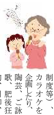
制度等)、カラオケを企画したり、陶芸、ご詠歌、肥後狂句、川柳、大正琴、天草宝島体操を企画して、それぞれの嗜好にあつた楽しい内容を積極的に考えています。

大切なのは、みんなが楽しくふれあう場を作ること、行事をこなすことではありません。