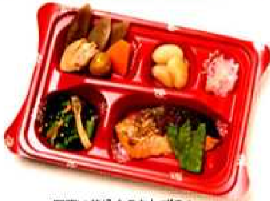
写真は普通食のおかずのみ