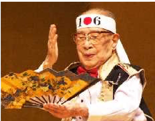
福岡教育大名誉教授。医学博士、文学博士の2つの博士号は森嶋外と昇地先生だけ

95才から中国語を学ぶ 100才でロシア語を学ぶ 100才から毎年世界一周旅行に出る 102才でフランス語を学ぶ (検査の結果、脳年齢は40代) 106才で世界最高齢者の最長移動距離のギネス記録(平成24年8月16日)を出す！ 同年11月28日 ベストレッサー賞受賞 同年11月29日 天草講演会 107歳 永眠(平成25年11月27日)