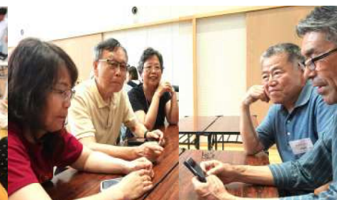
スマホの翻訳機能で会話中