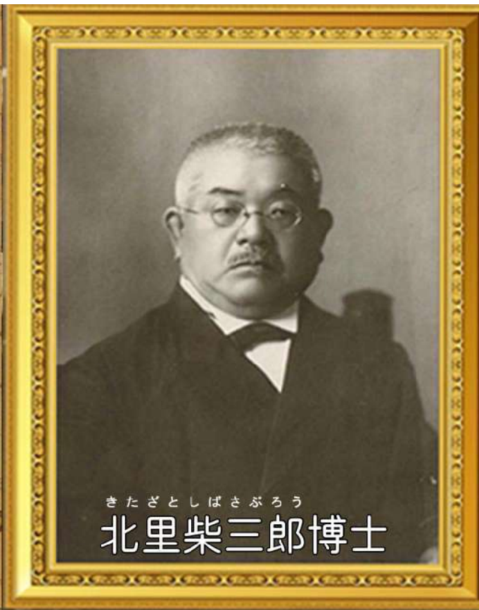
きたざとしばさぶろう 北里柴三郎博士