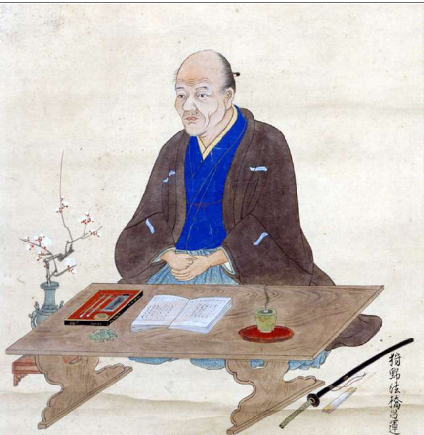
貝原益軒の肖像画