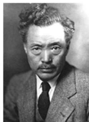
の ぐ ち ひ で よ 野口英世

北里柴三郎博士と宇良田唯女史 あなたは、天草が生んだ世界の偉人宇良田唯女史を御存じですか？ 貧しい人たちが等しく医療を受けて健康に暮らすため、国を越えて