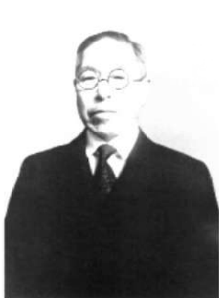
し が き よ し 志賀 潔