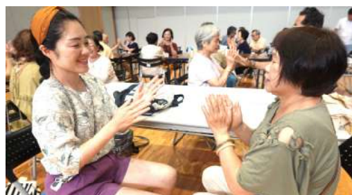
日本の歌で台湾の人と手遊び