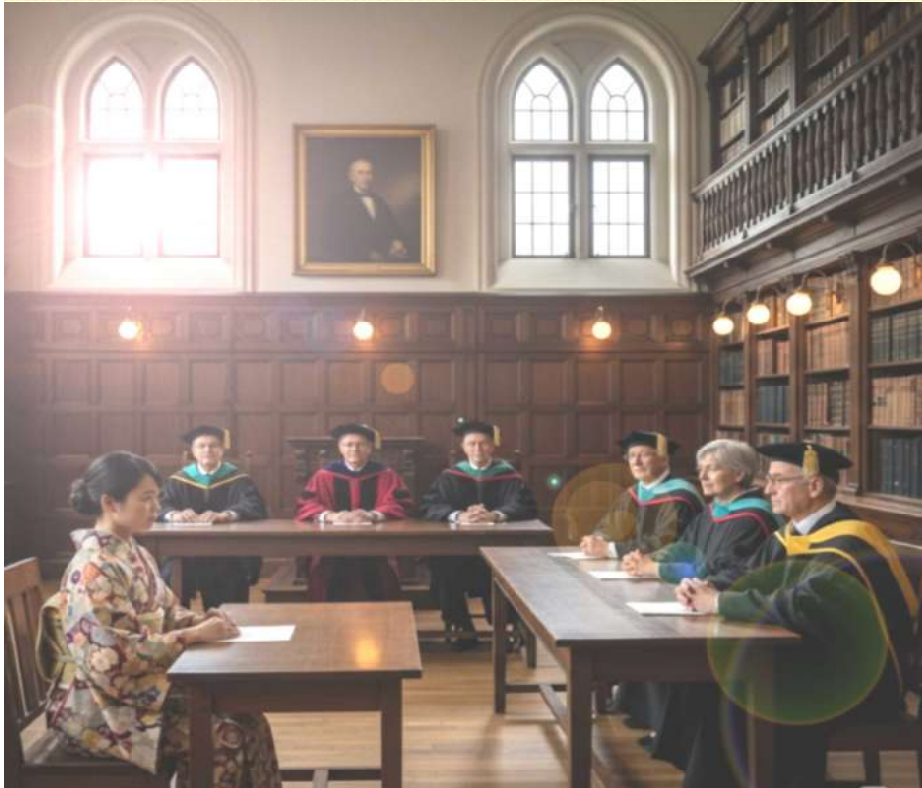
ドクトルメディツィーネを取得した口頭試問の様子(イメージ)