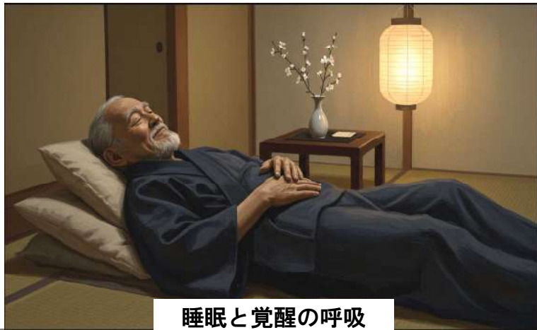
睡眠と覚醒の呼吸

人の身体は不思議なもので、吐く呼吸を長くするとアセチルコリンなど女性ホルモンの分泌が活発になり、副交感神経が優位となり余分な力が抜